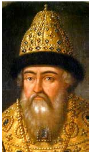
Sujszkij herceg - IV. Vaszilij cár

Sujszkij trónra lépése nem elégítette ki a bojárokat, a különféle nemesi csoportokat, a kozákokat és a német zsoldosokat, és a következő hét évben még két Dimitrij bukkant fel, az orosz parasztok körében tovább élt alakja. Miután szövetségre lépett a Svéd Királysággal, III. Zsigmond hadat üzent Oroszországnak, és kezdetét vette az 1609–1618 között tartó orosz–lengyel háború.