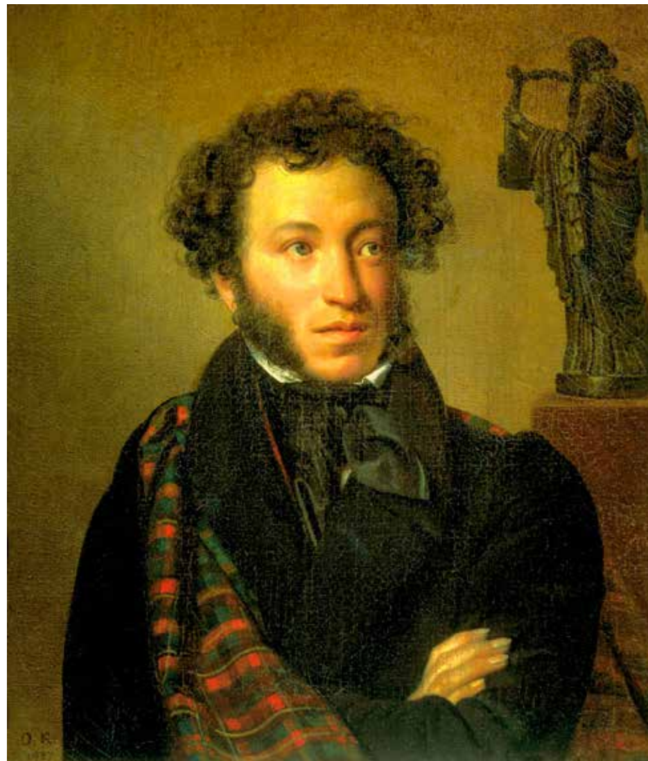
Oreszt Adamovics Kiprenszkij: Alekszandr Szergejevics Puskin 1799 - 1837

Puskin 1925-ben, dekabrista kapcsolatai miatt rárótt száműzetésében kezdi írni Borisz Godunov című drámáját, pontosabban, eredetileg tervezett címén: Komédia Borisz cárról és Griska Atrepjevről című művét. A készülő mű műfaját azonban hamarosan újragondolja.