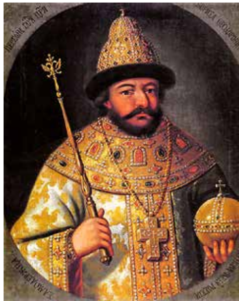
Borisz Godunov cár

1598. január 7-én meghalt I. Fjodor, anélkül hogy utódját kijelölte volna. A cárral vége szakadt a Rurik-ház hosszú évszázadokon keresztül uralkodó moszkvai ágának, s mivel nem volt szabályozott trónöröklési rend az örökös nélkül elhunyt cár utódlására, kétséges volt, ki a törvényes örökös. Ezt a bizonytalanságot használhatta ki Borisz Godunov, aki mivel a cár sógora volt, jó eséllyel pályázott a trónra.