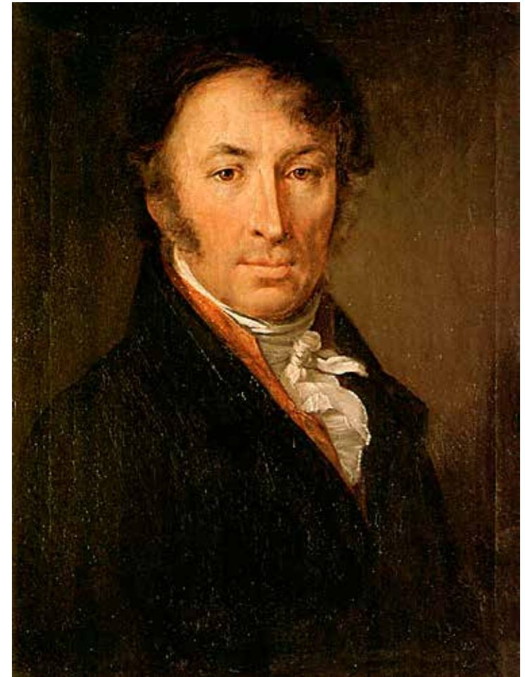
Vaszilij Andrejevics Tropinyin: Nyikolaj Mihajlovics Karamzin

sikere rendkívüli volt. Sok kortársát ez a könyv ébresztette rá, hogy hazájának van korai történelme. Bár szenvedélyes vitákat is kiváltott és a XIX. század közepére tudományos szempontból már elavult, mégis számos kiadást ért meg, és hatása az orosz történelmi- és nemzettudat alakulására hosszú ideig fennmaradt.