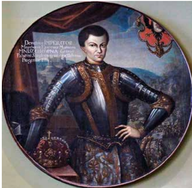
I. Ál-Gyimitrij orosz cár

Ilyen megközelítésben az álcár-jelenség nem annyira kifinomult ideológiai konstrukció, hanem meglehetősen durva, egészen a cinizmusba hajló pragmatizmus terméke. Elsődlegesen nem az »orosz nép« fennkölt szabadság vagy valamiféle elvont Megmentő iránti vágyát önti formába, de nem is a játszó hajlama vagy ösztönös »ellen-viselkedéskultúrája« testesül meg benne. (...) A kozákok azt adták, ami a valójuk volt: a merész, durva trükköt, és készek voltak ad absurdum vinni a kiinduló ötletet. Az ő kezükben ez a fegyver nem volt fejlődőképes, és teljesen lejáratták. A profán alkalmazáson túli szofisztikáit felhasználás már nem az ő műfajuk volt, és meg is haladta képességeiket, de ez irányú ambícióikat is. Ez ugyanis már politikusok műve volt. I. ál-Gyimitrij pedig az volt, mégpedig leleményes politikus. Hasonlóképpen tehetségesek voltak a »nemesi demokrácia« politikai kultúrájában szocializálódott lengyel tanácsadói is. Az ő propagandájukban körvonalazódik az a mese, amely alkalmassá válik a csaló cárrá transzformálásra, a csalás szakralizálására.