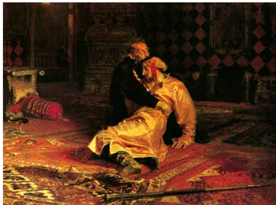
Ilja Repin: Rettegett Iván megöli fiát (1883-85)

IV. Ivánnak három fia volt. Iván, akit 27 évesen az apja, maga Rettegett Iván ölt meg egy dührohamban, Fjodor és Gyimitrij (1582-1591). Utóbbi mindössze 2 éves IV. Iván halálakor.